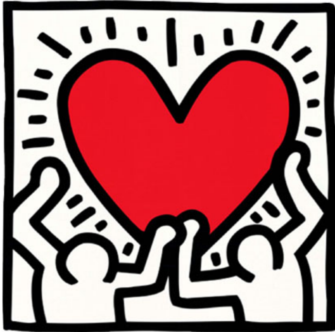
IMAGEN: Keith Haring