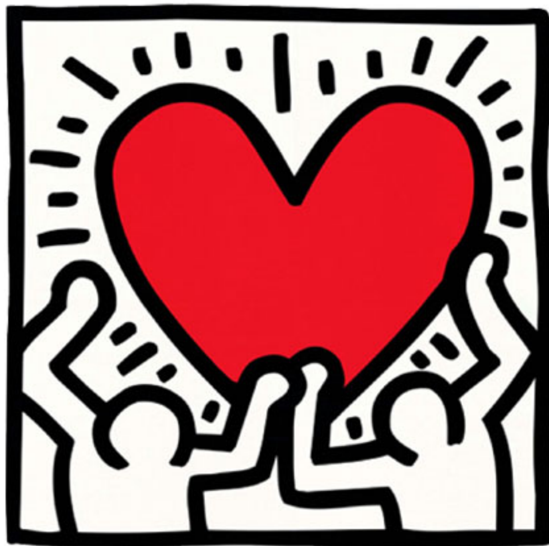
IMAGEN: Keith Haring

DIA NACIONAL DE DONANTES DE ÓRGANOS Y TEJIDOS