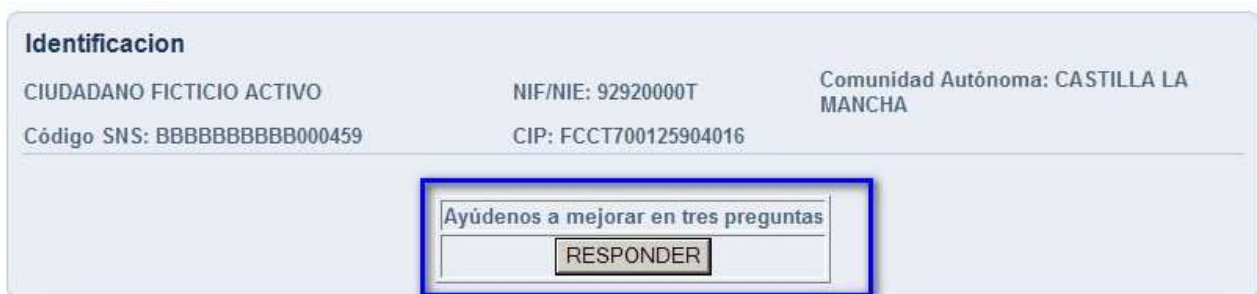
Fig. 16. Situación del botón de acceso a la encuesta

Por último, se debe destacar que en todas las pantallas se puede observar, debajo de los datos identificativos del ciudadano, que existe un mensaje que dice “Ayúdenos a mejorar en tres preguntas” e inmediatamente debajo aparece un botón con el identificador “Responder”.