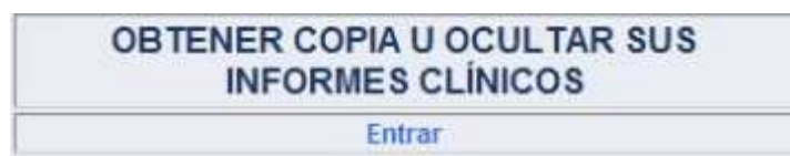
Fig. 7. Visualización de documentos

Al pulsar en enlace “Entrar” se muestra la siguiente pantalla: