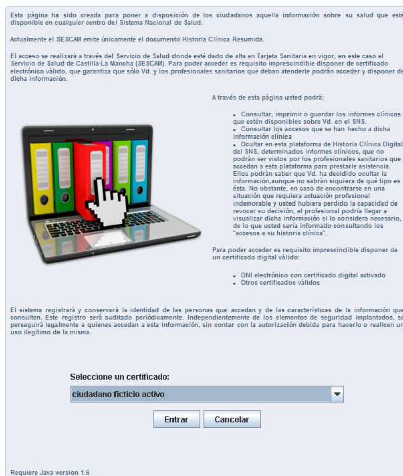
Fig. 1. Información general y selección de certificado.

Cuando se acceda a la aplicación se mostrará una opción para que el usuario pueda indicar el certificado con el que quiere acceder. Si se trata de un certificado no válido, se abrirá una pantalla de error.