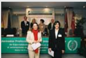
Entrega de las becas de investigación en Atención Farmacéutica

Cátedra Universidad de Granada-Sandoz de Docencia e Investigación en Atención Farmacéutica