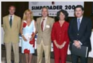
Entrega de la beca de Coordinación y Realización de Tesis Doctorales en Atención Farmacéutica

Convocatoria de dos Becas para la realización de Estudios de Investigación en A.F.